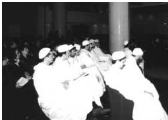
Un gruppo di delegati regionali della CO.RE.IS. ha partecipato alla preghiera interreligiosa che ha chiuso il convegno.

È pertanto facile, per noi musulmani, riconoscere la validità delle comunità religiose di profeti islamici precedenti la rivelazione coranica nella quale sono tutti contemplati fino all'annuncio della venuta di Muhammad ( çalla Allâhu 'alayhi wa çallam ), fatto proprio dal Cristo stesso (Cor. LXI, 6); ed è lo stesso Corano che nella sura V, 48 ci dice: "A ognuno di voi (Ebrei, Cristiani, Musulmani) abbiamo assegnato una regola e una via, men-