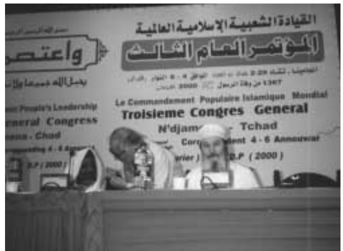
Il tavolo della presidenza del Congresso Generale della Leadership Popolare Islamica Mondiale (World Islamic People's Leadership - WIPL) a D'jamena, capitale del Ciad.

mico non si è ancora ripreso. Molte delle stesse organizzazioni "internazionali" islamiche in realtà non fanno che perseguire interessi nazionali e non si curano realmente degli interessi religiosi della ummah , la comunità islamica. Il Congresso Generale si è proposto quindi di sostenere quegli stati e quelle organizzazioni che ritrasmettono gli aspetti religiosi dell'Islam e, al tempo stesso, prendono concretamente le distanze dal fondamentalismo sedicente islamico. Infatti, è emersa durante i lavori la convinzione che la comunità potrà ritrovare la propria unità spirituale ribadendo quell'ortodossia religiosa e quell'ispirazione spirituale che i fondamentalisti hanno voluto violare, spesso su istigazione proprio delle nazioni coloniali. Soprattutto i rappresentanti dei paesi africani, infatti, hanno sottolineato quanto