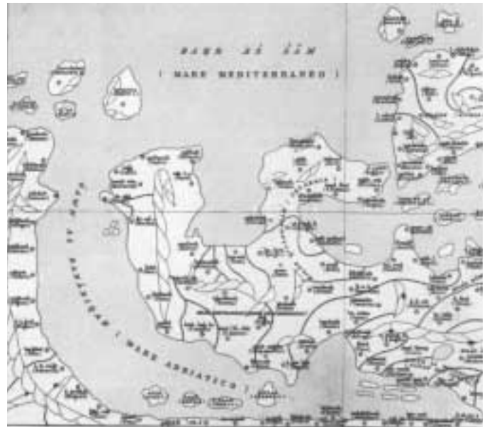
L'Italia nella prospettiva "africana" del geografo Ibn Idriss, cartina realizzata per conto del re normanno Ruggero II di Sicilia (1154).

spettiva di approfondimento della dimensione intellettuale dell'Islam si verifichi anche una naturale convergenza tra musulmani orientali e occidentali. Dal confronto è emerso che il dibattito sui pericoli, per il mondo islamico, di una perdita della propria identità, può essere proficuo solo se riconduce alla riscoperta dei fondamenti della religione islamica e della storia della civiltà che ne è scaturita, per cogliere il modo in cui questa stessa civiltà ha saputo, in passato, porsi, con rispetto, nei rapporti con le altre civiltà e confessioni religiose. Il richiamo proveniente dal Cairo ha voluto sottolineare la specificità della tradizione islamica che unisce e plasma tutte le dimensioni del sapere. Risulta così evidente che i riferimenti fondamentali che sono alla base della concezione del mondo occidentale, quali libertà, sapienza o democrazia, per fare solo alcuni esempi, non devono essere tradotti solo linguisticamente, ma anche, e, soprattutto, concettualmente per poter stabilire un confronto reale tra il mondo islamico e quello occidentale. Gli interventi della CO.RE.IS. hanno richiamato la comunità islamica a ritrovare quel carattere di universalità e di eternità della propria tradizione che ha permesso di convivere con culture molto diverse tra loro adattandosi a vari contesti mantenendo però una sua identità e specificità sul piano spirituale.