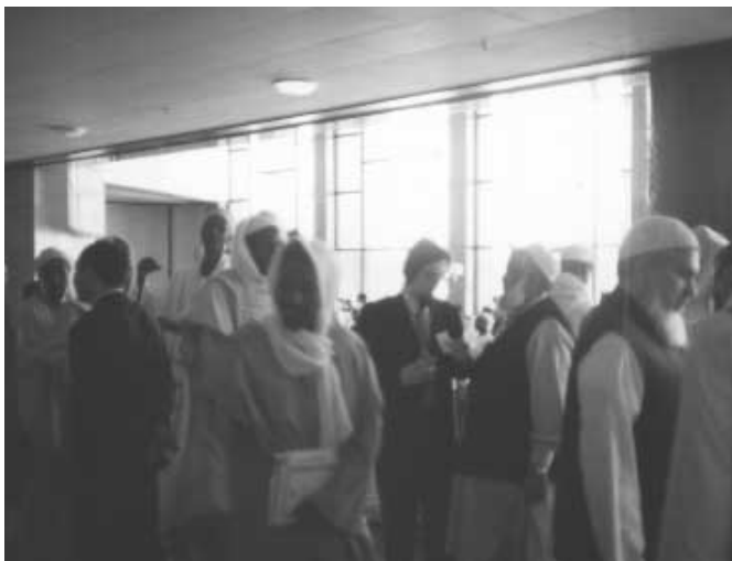
N'djamena, nel cuore dell'Africa, ha accolto con grande ospitalità una delle più consistenti rappresentanze finora riunite per discutere dei problemi della comunità islamica nel mondo.

lavori del Congresso, con la funzione di coordinare in particolare i progetti relativi all'Europa e alle Americhe, infine è stato nominato per acclamazione membro del ristretto Comitato Esecutivo della Leadership Popolare Islamica Mondiale. L'impressione destata dai membri della CO.RE.IS., tra i pochissimi musulmani occidentali presenti, l'attenzione prestata alle esperienze maturate in Europa nell'ultimo decennio, e la profonda sintonia spirituale trovata nel cuore stesso dell'Africa, sono elementi che fanno comprendere come le sorti religiose della comunità islamica dipendano sempre più dalla capacità di riconoscere quella leadership naturale rappresentata dai "sapianti", nel senso etimologico di coloro che conoscono il sapore della religione, lo Spirito che vivifica, e non soltanto la lettera, che uccide.