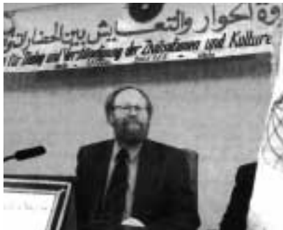
Il Presidente del Parlamento tedesco Wolfgang Thierse al convegno di Berlino.

tuali tendenze la riflessione del teologo Hans Küng che ha tentato di applicare anche in ambito islamico una lettura della storia religiosa come una successione di "paradigmi" che esprimono solo particolari tendenze individuali, ponendo sullo stesso piano l'Islam profetico o quello dei vari califfi come quello dei buoni o dei cattivi successori. Bene e male, luci e ombre, sarebbero parte integrante della religione, e le tendenze, più o meno elevate, che si impongono in certi momenti storici all'interno delle varie