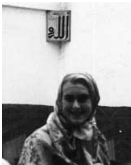
Casale Monferrato, e nell'ultimo quinquennio ha svolto un'attività di informazione sull'Islam in collaborazione con diversi circoli culturali e Università Popolari

Per rispondere a una precisa necessità di rappresentanza islamica particolarmente sentita in Piemonte, la CO.RE.IS. Italiana si sta attualmente impegnando in un dialogo con le istituzioni proponendosi in un progetto di mediazione culturale che possa essere il punto di riferimento per tutte quelle realtà religiose o civili che si trovino a interagire con i musulmani e quindi con l'Islam in tutti gli ambiti, come per esempio quello lavorativo o educativo. Questo progetto potrebbe rispondere ad alcune delle esigenze individuate dalla Legge