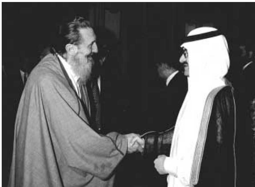
Lo Shaykh 'Abd al Wahid Pallavicini e S.A.R. il Principe Muhammad bin Nawaf bin 'Abd al Aziz as-Saud, Presidente del Consiglio d'Amministrazione del Centro Islamico Culturale d'Italia della Moschea di Roma, e Ambasciatore in Italia del Regno dell'Arabia Saudita.

1997. Accordo bilaterale con l'ISESCO, l'Organizzazione Islamica per l'Educazione, la Scienza e la Cultura della Organizzazione della Conferenza Islamica (OCI), che con 54 paesi membri è la più grande organizzazione internazionale dopo l'ONU.