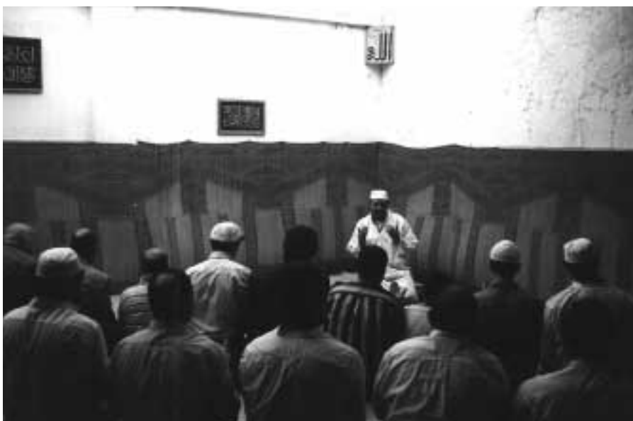
Un momento della preghiera nella futura moschea di via Meda. Gli scambi fra le principali moschee delle grandi città d'Europa hanno un'importanza fondamentale per arginare le correnti ideologiche, che non a caso si nascondono dietro le realtà non ufficiali situate per lo più nei quartieri periferici.

Kebtane, la rappresentanza della comunità lionese si è intrattenuta con i membri della CO.RE.IS. Italiana, svolgendo le preghiere rituali e mettendo a punto i prossimi progetti comuni.