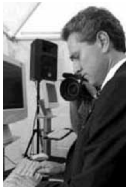
Francesco Rutelli in una recente immagine.

La responsabilità della CO.RE.IS. di rappresentare non solo gli interessi della comunità islamica nazionale, ma anche quelli legati alla sua presenza nel Lazio sono state recentemente oggetto di una conferenza stampa nella sala della Provincia di Roma. Parallelamente il mese scorso è stato possibile presentare le attività passate e i progetti futuri al sindaco di Roma Francesco Rutelli, particolarmente sensibile allo sviluppo di una società multietnica, pluriconfessionale e interculturale.