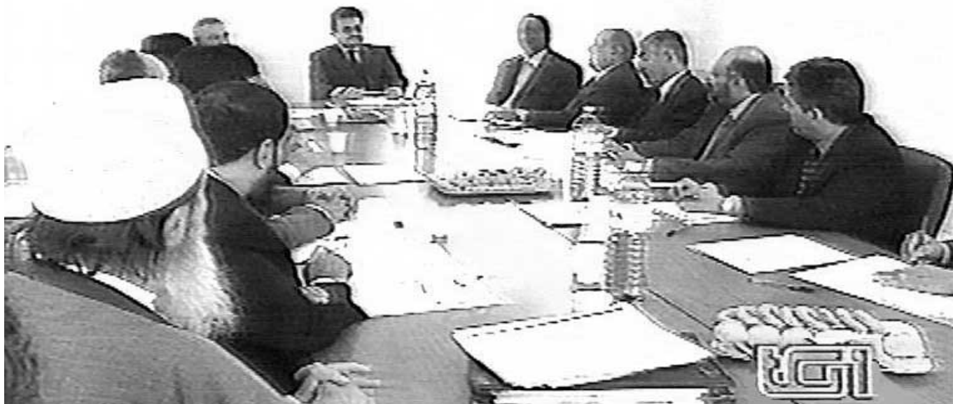
La riunione del Consiglio d'Amministrazione della Moschea di Roma tenutasi il 28 settembre, qui nella ripresa del Tg 1 mandata in onda alle ore 20.

L'Imam della Moschea di Milano entra a far parte del Consiglio d'Amministrazione della Moschea di Roma