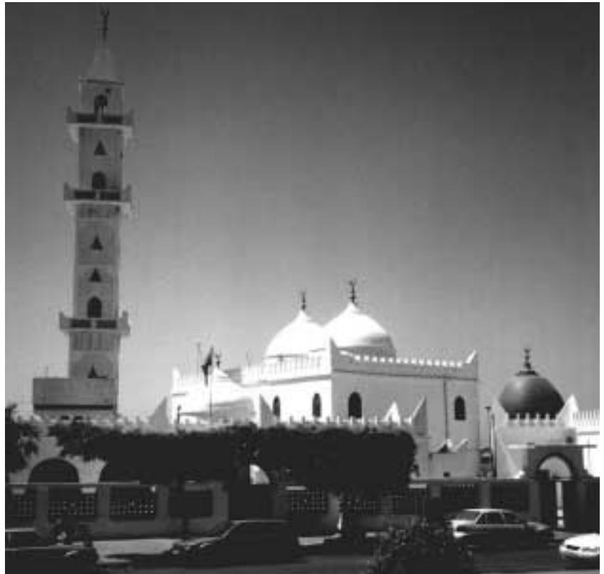
Tripoli: la Moschea di Sidi 'AbdAllâh al-Shabb, di fronte al centro congressi dell'Hotel Mehara, dove si è tenuto l'incontro della WIPL, è uno dei centri spirituali di una città nella quale la dimensione interiore dell'Islam è tutt'ora molto vitale.

Le vicissitudini della storia hanno fatto sì, infatti, che la Libia abbia trovato un raro equilibrio tra la volontà di mantenere l'identità tradizionale islamica e quella di avviare un necessario sviluppo economico e sociale. Anche in Italia, d'altronde, sono noti i pericoli di un'assunzione indiscriminata di modelli culturali provenienti da paesi occidentali nei quali via via una minore sensibilità nei confronti delle radici tradizionali e religiose dei popoli. Non solo ci si auspica, quindi, che nelle moschee e nei luoghi santi della Libia possa conservarsi a lungo quel deposito tradizionale immutabile che costituisce l'essenza del culto a Dio, dîn al-qayyima , ma si spera che presto anche in Italia vi sia un centro spirituale in cui si possa trovare un analogo sostegno interiore.