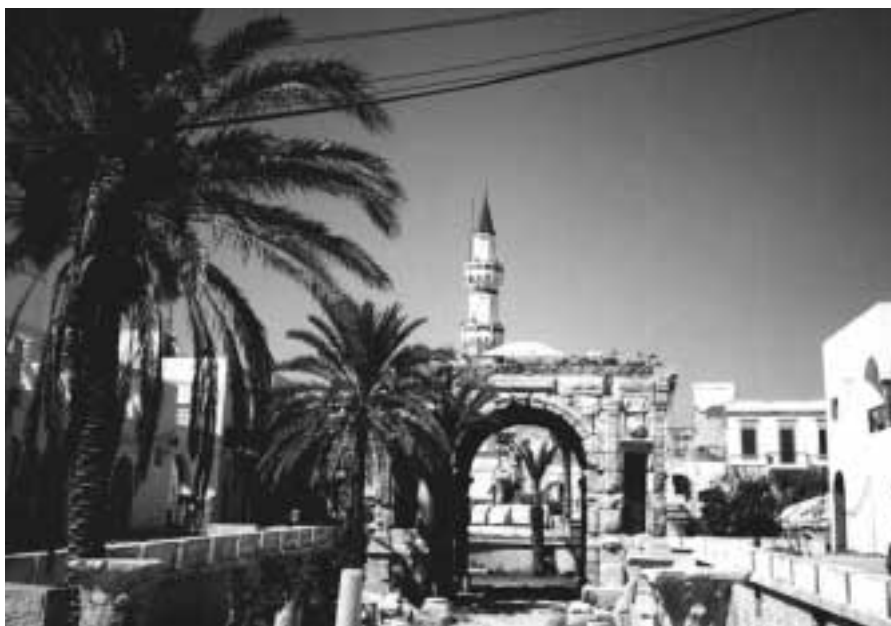
In Libia, più che altrove, appare evidente la continuità tra le diverse civiltà del Mediterraneo. In primo piano, l'arco romano di Marco Aurelio (163 d. C.)

In questo senso, il ruolo della CO.RE.IS. Italiana, fondato sulla realtà di una comunità di musulmani italiani, risulta effettivamente determinante. Infatti, la CO.RE.IS. costituisce una prova evidente del fatto che è possibile far cam-